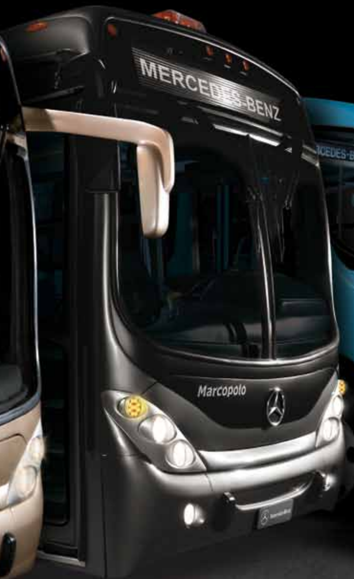
Gran Viale RF