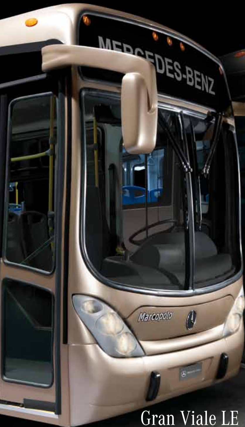
Gran Viale LE