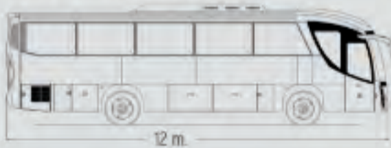
Modelo 12 Chasis 1625/30L EuroV