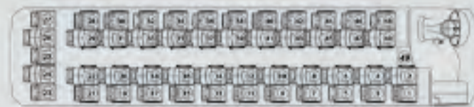
Modelo 11.2 Chasis OH 1625/30L EuroV