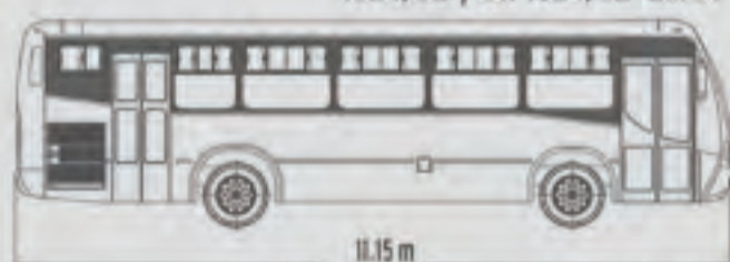
Modelo 1524/52 y 1624/52 Chasis OH 1524/52 y OH 1624/52 EuroV